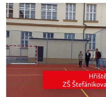
Hřiště ZŠ Štefánikova

proinvestovalo v loňském roce město do technické a stavební modernizace škol. Přepočteno na jednoho žáka jde téměř o 9 tis. Kč.