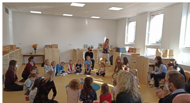
Veřejná ZŠ Montessori

činnost Dětského i Studentského parlamentu. Naopak se podařilo udržet stabilní financování škol z rozpočtu města a rozvíjet projekt psychologů ve školách, jejichž důležitost teď jednoznačně narůstá. Pořádáme pravidelné vzdělávání ředitelů a ředitelky, realizujeme tandemový mentoring a koučink pro začínající ředitele, zajišťujeme preventivní programy proti šikaně a pro dobré klima v třídním kolektivu ve školách. Pozitivně se projevila naše velmi dobrá vybavenost informačními technologiemi, s jejichž používáním se pedagogové v posledních letech velmi posouvají dopředu. Školy jsou také velmi aktivní v projektu MŠMT zaměřeném na doučování dětí, které potřebují dohnat výuku po dlouhém uzavření škol. V souladu se strategií jsme