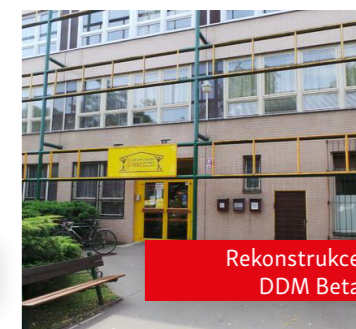
Rekonstrukce DDM Beta

Opotřeбенé a nevyhovující povrchy jsme nahradili novými. Doplněn byl také mobiliář včetně sportovních pomůcek.