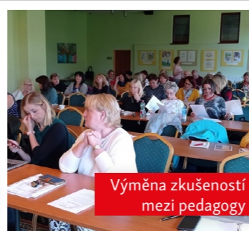
Výměna zkušeností mezi pedagogy

Školní psycholog je zajištěn pro každé školní poradenské pracoviště, a to podle velikosti školy na potřebnou část úvazku.