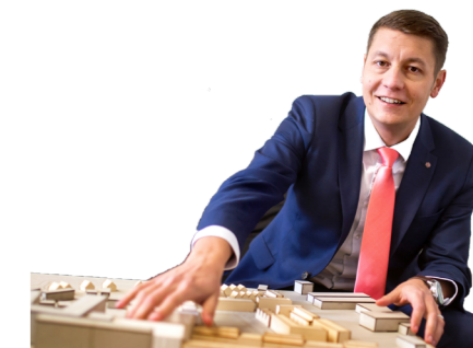
Jakub Rychtecký náměstek primátora

Je to úplně obyčejné lidské přání, ať je nejenom ten školský svět zase úplně normální. To by nám všem, tj. žákům, rodičům, pedagogům, nepedagogům, ředitelům, ale i kolegyním a kolegům z odboru školství vedle zdraví a lásky asi úplně stačilo.