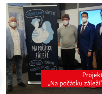
Projekt „Na počátku záleží“

Spustili jsme informační platformu k pardubickému školství. Najdete zde aktuální informace a rovněž můžete odebírat newsletter.