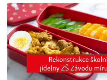
Rekonstrukce školní jídelny ZŠ Závodu míru

Pokračujeme v realizaci projektu podporující integraci dětí cizinců ve školách.