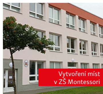
Vytvoření míst v ZŠ Montessori

Průběžně budujeme nové kapacity pro naše děti a žáky. Ve stávajících školách modernizujeme vybavení, ať už se jedná o jídelny, tělocvičny nebo okolí škol.