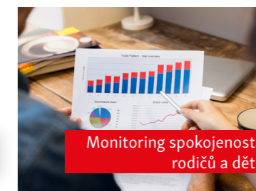
Monitoring spokojenosti rodičů a dětí

Dlouhodobě podporujeme zdravé a chutné stravování dětí, jehož součástí je i příjemné prostředí.