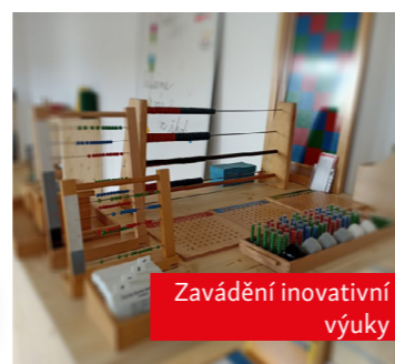
Zavádění inovativní výuky

Na projektu proběhly první stavební práce a příprava vzdělávací části. Hrubou stavbu dokončíme v roce 2022.