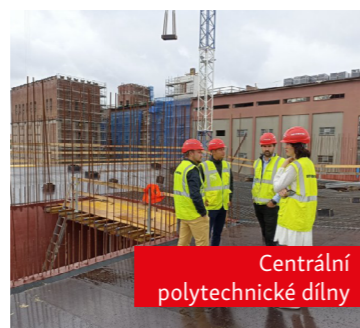
Centrální polytechnické dílny

Výuka musí odpovídat moderním trendům a připravovat děti a žáky na život a práci ve 21. století. Úsilí proto věnujeme jak místu, které inspiruje naše žáky, tak i formě a způsobům výuky.