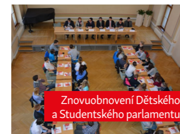
Znovuobnovení Dětského a Studentského parlamentu

Po třech letech zopakujeme realizaci výzkumu spokojenosti mezi dětmi, rodiči i zaměstnanci.