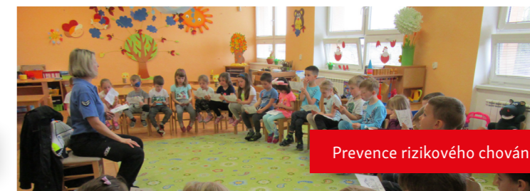
Prevence rizikového chování

Po covidové pauze obnoví svou činnost obě iniciativy. Pravidelně proběhnou diskuse, setkání s veřejnými činiteli, návštěvy institucí.